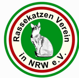
Neues Logo des RKV

- der Vereinsname ist nun im Logo enthalten