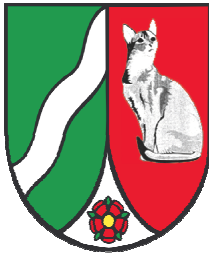
Altes Logo des RKV

gerechnet in unserem Jubiläumsjahr (der RKV ist tatsächlich bereits vor 20 Jahren gegründet worden) aufgeben. Wir haben ein neues Logo entworfen und auf der Homepage bereits angepasst. Dies solltet Ihr auf Eurer Homepage ggfs. auch nachholen. Wir hätten Euch gern in die Umgestaltung einbezogen, haben aber vom Amt weder zeitlichen noch kreativen Spielraum erhalten. Das neue Wappen spiegelt aber bereits unseren bisher genutzten Stempel sowie die altbekannte Katze wider. Etwas Gewöhnung wird es brauchen, aber trotz der Fremdbestimmung sind wir mit dem Ergebnis zufrieden.