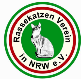
Neues Logo des RKV

- der Vereinsname ist nun im Logo enthalten